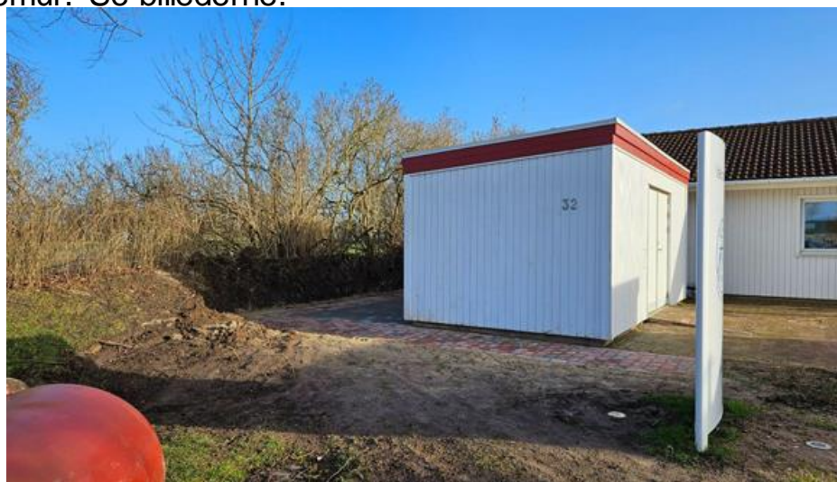
Nyt skur etableres på bagsiden af eksisterende skur