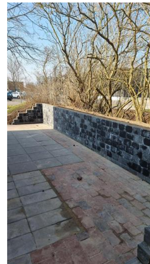
Belægning og støttemur klar for udvidelse af skuret